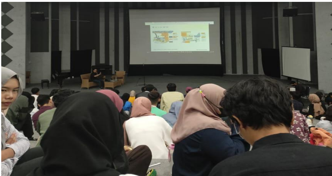
Gambar 1.2 Mahasiswa adiberikan materi bisnis dari founder bisnis berpengalaman