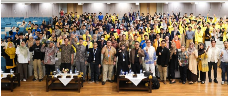
Gambar 1.1 Program wirausaha merdeka angkatan 2 yang dilakukan perwakilan mahasiswa UTA'45 Jakarta di Wira Cipta UI