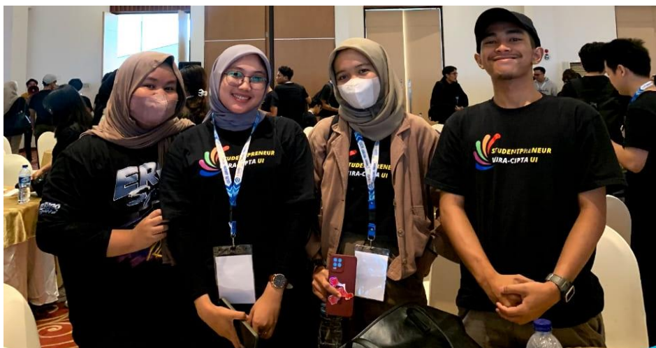
Gambar 1.3 Mahasiswa mengikuti kegiatan company visit di PT JAYA ANCOL